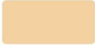
Happy Ivory S-6102