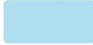
Rainy Lake S-6501