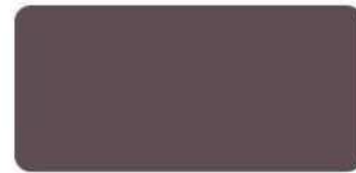
Vision Brown S-6806