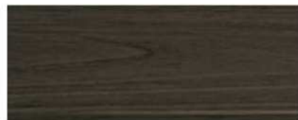
M-7108 ไม้มะเกลือ Ebony