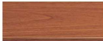
M-7109 ไม้มะฮอกกานี Mahogany