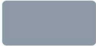
Winter Grey S-6702