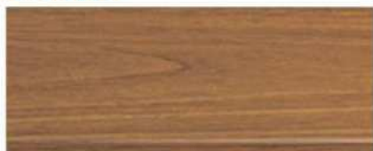
M-7102 ไม้สัก Teak