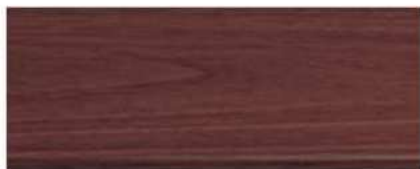
M-7105 ไม้แดง Redwood