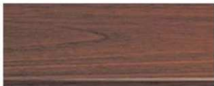
M-7111 ไม้โอ๊ค Oak