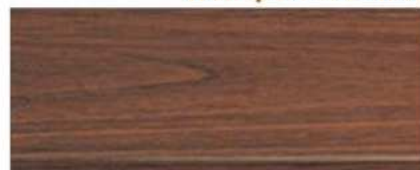
M-7104 ไม้ประดู่ Afromosia